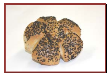
Pan de sésamo con nueces