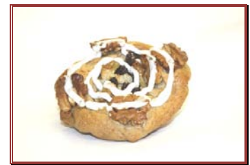
Kurumi pan con crema