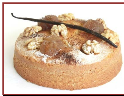
Torta de Nuez