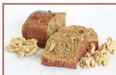
Panes de molde con nueces enteras